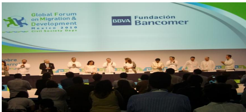
DMK auf Global Forum on Migration & Development in Mexiko, 8-10 November 2010