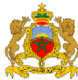
Marokkanische Botschaft Berlin

Unser Dank gilt allen Förderern und Partnern, ohne deren ideelle und finanzielle Unterstützung die Realisierung unserer Arbeit in dieser Form nicht möglich wäre. Wir danken und freuen uns auf weitere Partner, Förderer und Sponsoren!